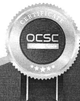
(นายปยวัฒน์ ศิวรักษ์) เลขาธิการคณะกรรมการข้าราชการพลเรือน

[รวมระยะเวลาทั้งสิ้น 4 ชั่วโมง] ให้ไว้ ณ วันที่ 28 มกราคม พ.ศ. 2565